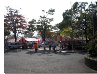
当日は快晴で、野外会場も大盛況