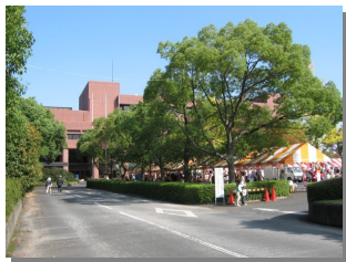
館林市役所の建物