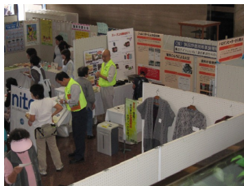
NITEスタッフに質問する来場者